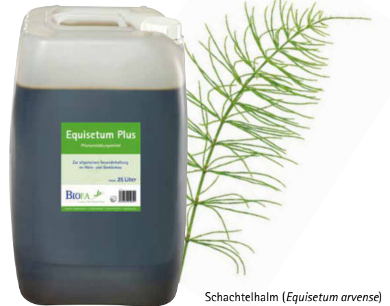
Schachtelhalm ( Equisetum arvense )

Aufgrund seines hohen Siliziumgehaltes fördert Equisetum Plus die Ernährung und Kräftigung der Pflanze. Natürliche Kieselsäure wird verstärkt in die Zellwände eingelagert (Verkieselung) . Dies festigt Zellwände und Epidermis und stärkt somit die Pflanzen gegenüber abiotischem Stress und schwächebedingtem Pilzbefall.