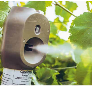
Präzise und gleichmäßige Freisetzung der Pheromone durch automatisierte Zeitschaltung