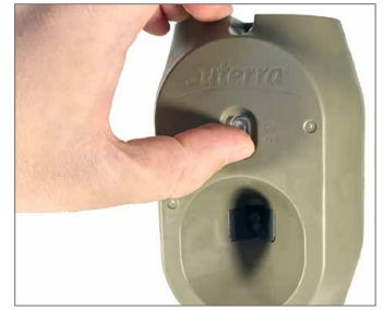
Aktivierung mit einem Klick