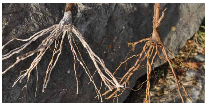
Links: Pfropfrebe vor der Pflanzung in Lösung aus Mykorrhiza-Sporen und Bentonit getaucht

Um eine rasche Etablierung des Pilzes an der Wurzel zu erreichen, wird eine Ausbringung von 400 Sporen / Pflanze empfohlen. Dies sollte durch das Eintauchen der Pfropfreben vor der Pflanzung in eine mit Mykorrhizasporen versehene wässrige Lösung erfolgen. Um eine bessere Anhaftung der Sporen an der Wurzel zu bekommen, sollte die Tauchlösung mit 0,5 kg Bentonit / l Wasser versehen werden. Die Lösung wird 1 Stunde stehen gelassen und anschließend noch einmal gut aufgerührt. Die benötigte Menge an Tauchlösung ist stark abhängig von der Länge der Wurzeln (maschinelle / manuelle Pflanzung) bzw. Viskosität der Lösung und liegt zwischen 10 und 20 l / 1.000 Pfropfreben. Überschüssige Tauchlösung kann verdünnt und zum Angießen der Reben verwendet werden.